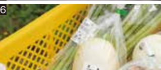
15 やさい工房 沙羅に農産物を納入する契約農家は80軒ほど。16 家庭向けの洗剤や調味料なども置く、地域によるず屋さん。17 ももは工房では「大肥の庄みそ」を中心に、野菜あられや田楽みそなども作って販売している。