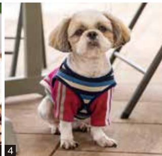
1 国道沿いに立つこぢまりとしたお店「カフェアウローラ」。2 店内は12席。地元作家の作品やアウローラオリジナルコーヒーなども販売。3 三隈川河畔のテラス席が心地いい。競技ボートの選手たちが練習する姿を見ることが多い。4 とってもお利口さんの看板犬「クー」。5 日田で昔から食べられているローカルおやつ「へこ焼き」とドリンクのセット950円。本来は小麦粉の生地を焼いた素朴なものだが、カフェ仕様でおしゃれなスイーツに。