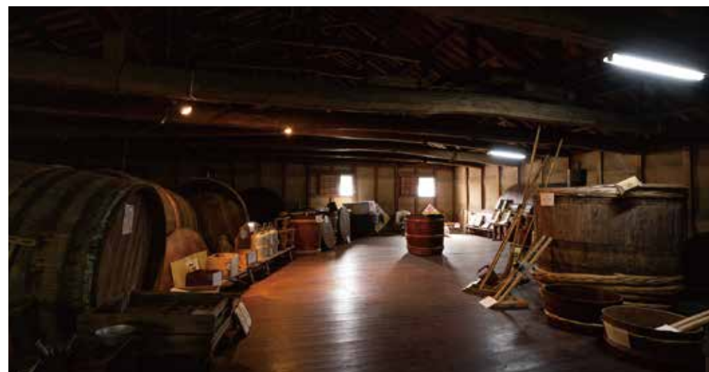
6 井上酒造の木造蔵。1937年、地元大工と近所の方々が協力して築き、豪雨災害でもびくともしなかった。7 地元の米だけでつくる「百合仕込み」。8 店舗兼住居としても現役の「清溪文庫」。9 井上準之助の遺品や資料を展示。10 7代目の井上百合さん。仕込み時期は、この蔵室で一晩過ごす。

な木造の大酒蔵と共に、「清溪文庫」と称する本宅もぜひ見学しておきたい。そしてすぐ近くの老松酒造も1789年創業の老舗。こちらは地元の麦を使った焼酎に力を入れていて、樽で熟成させるため、洋酒のような香りを楽しめる。評判のお米や旬野菜を手に入るなら、惣菜やパンもおいしいやさい工房沙羅へ。また、地元の麦・米・豆で丁寧を作る、ももは工房のお味噌も外せない。やはりこの地域を旅すると、買い物袋がすぐに満杯になってしまう。