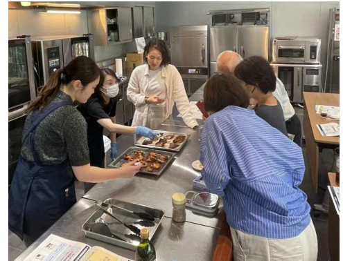
テストキッチンにある機器を使って調理する過程を見学しました。

今後、試作をしながら取り組んでいきますので、興味のある方は是非、ご連絡ください。