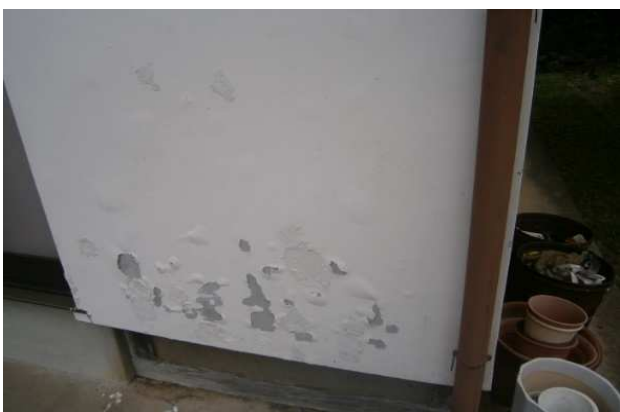
外壁塗装 一部捲れ