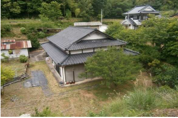
上部より全景（左側車庫）