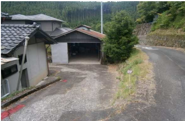
前面道路から進入路（正面：車庫）