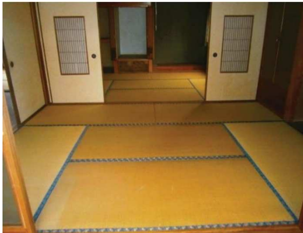
1階二間続きの和室