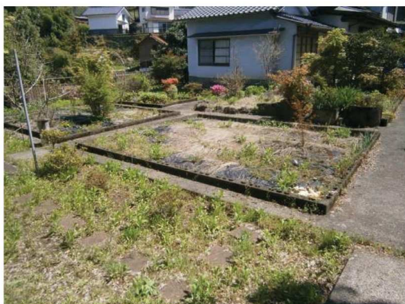
敷地内 家庭菜園利用可