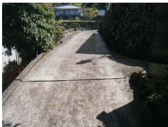
物件出入口の共用道路