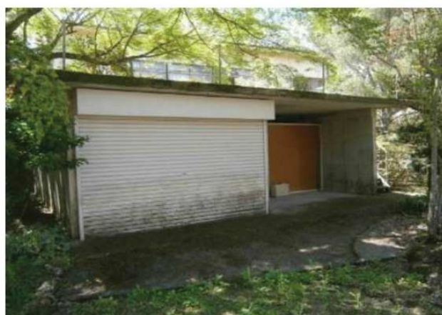
附帯物件：倉庫 4.7m * 4.5m