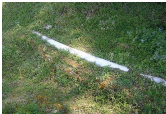
湧き水の通る管 (自治会管理)