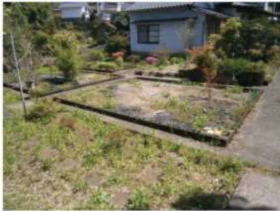
敷地内 家庭菜園利用可