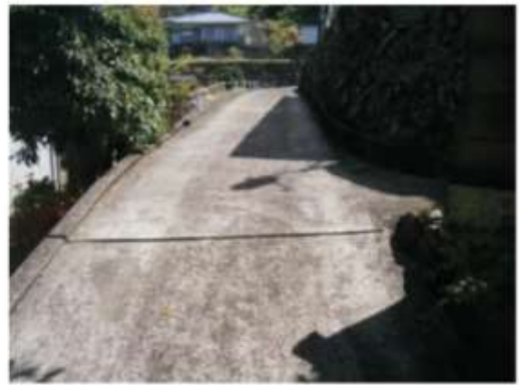
物件進入口の共用道路