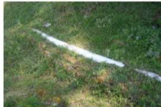
湧き水の通る管 (自治会管理)