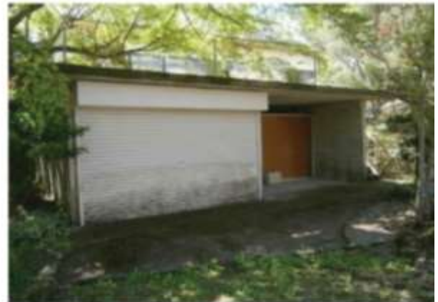
附帯物件：倉庫 4.7m * 4.5m