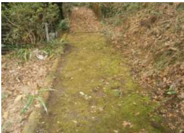
前面道路（共有地）幅員2m