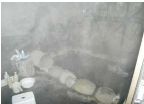
浴室（温泉かけ流し）