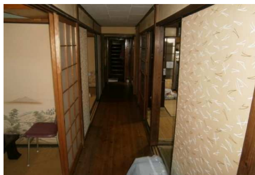
玄関から奥の階段へ