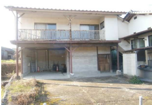
母屋に隣接の二階建て車庫・居室