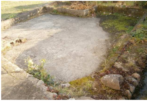
車庫の奥の空き地(池として使用可)