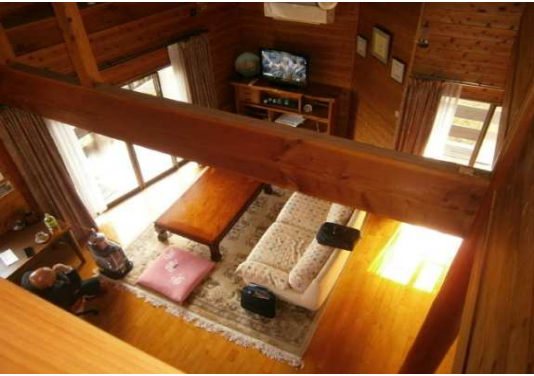
3階から吹き抜けを臨む