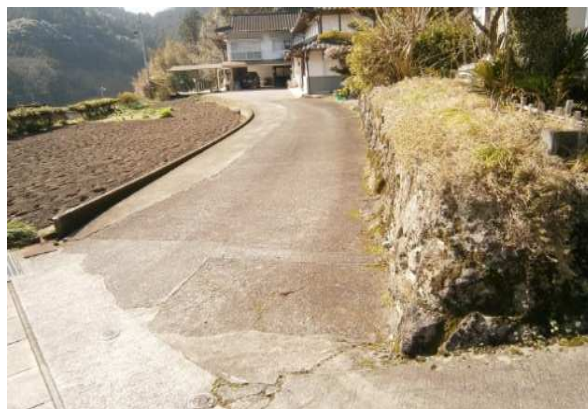
別棟のコンクリート造りの倉庫