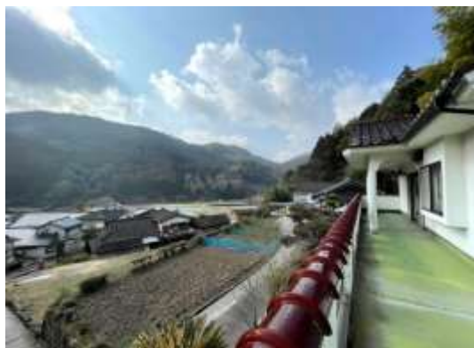
2Fバルコニーからの景色