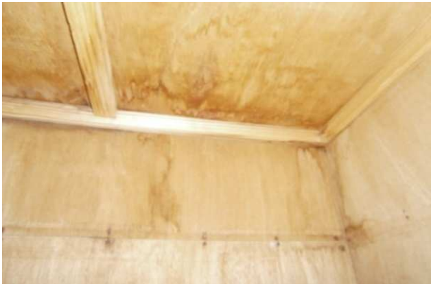
仏間の横の押し入れ (雨漏りの形跡あり)