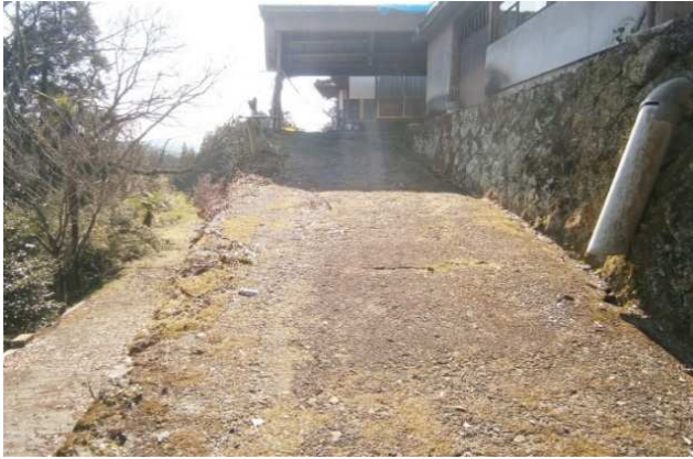
進入路から玄関口へ向かう