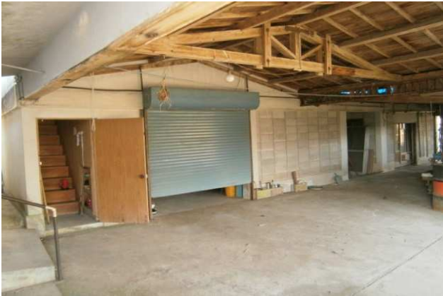
隣接二階建て（一階倉庫、二階居室）