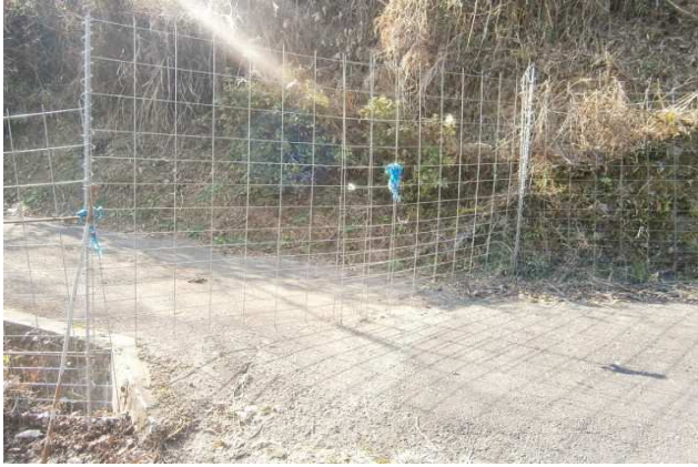
進入路にある手作りのゲート