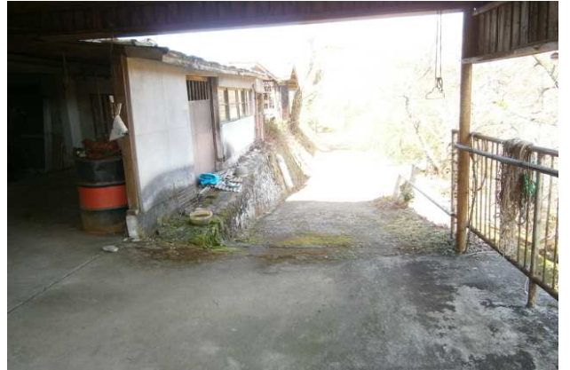
玄関側から進入路を臨む