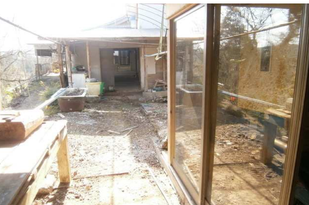
奥の倉庫側から勝手口を臨む