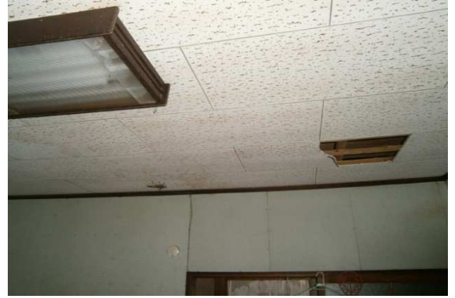
台所天井に二つの穴あり