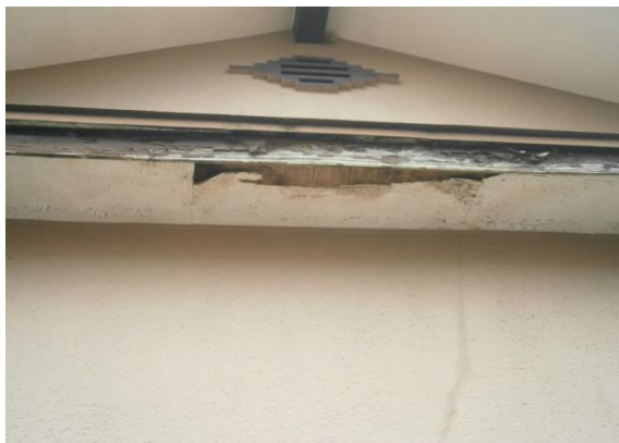
キッチン外軒先雨漏りあり