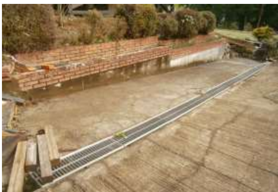
駐車場（縦列駐車2台可能）