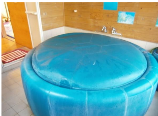
浴室(40℃程の温泉が出ます)