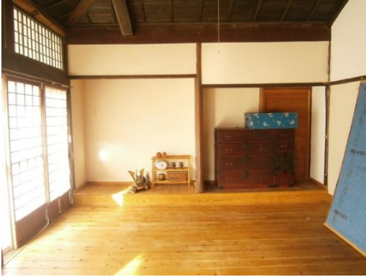
和モダンなリビング