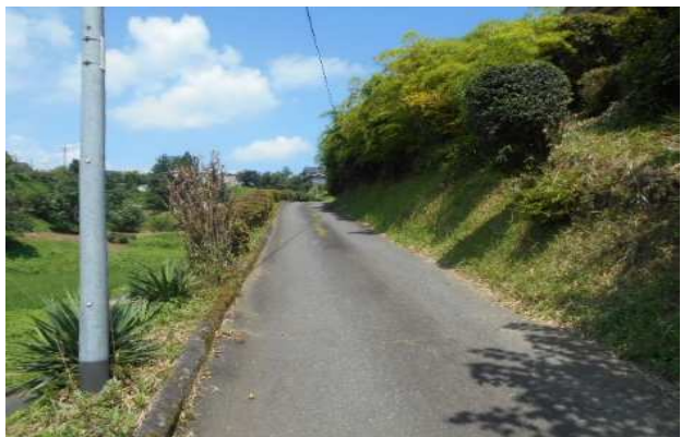
前面道路右側が宅地、左が花壇