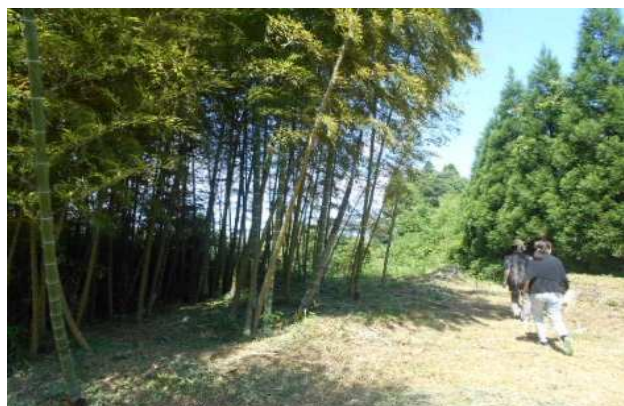
手入れされた山林