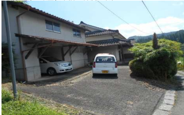
外観（奥：母屋、手前：付属建物）