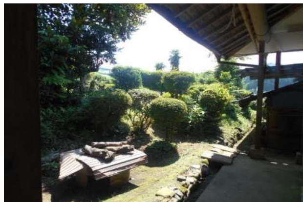
居間からみた景色