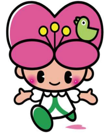
大分県人権啓発イメージキャラクター こころちゃん