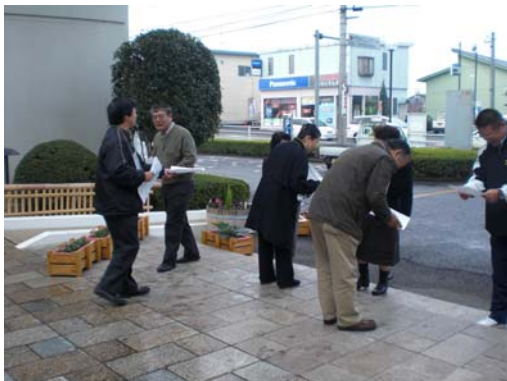
*エコドライブ啓発活動