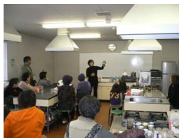
《ごみ・リサイクル部会》