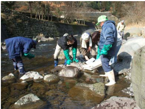
*全国一斉水質調査