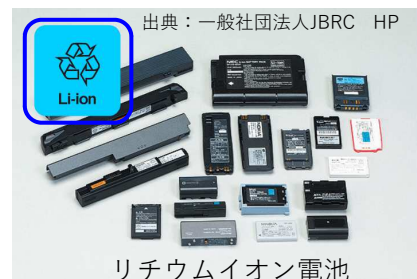
リチウムイオン電池