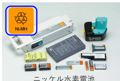
ニッケル水素電池