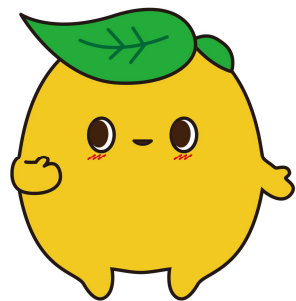
環境教育マスコットキャラクター エコ助