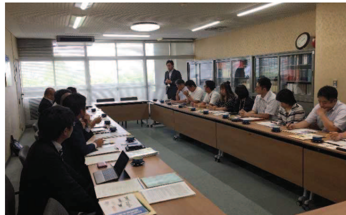
➤ 右手が日田市中小企業振興推進会議の委員(専門部会員) ・参加者全員が大村市の取組に賛同