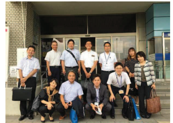
➤ 日田市視察団 ・この視察を通じ、中小企業者自らが中心となり課題研究等を行う決意を持った