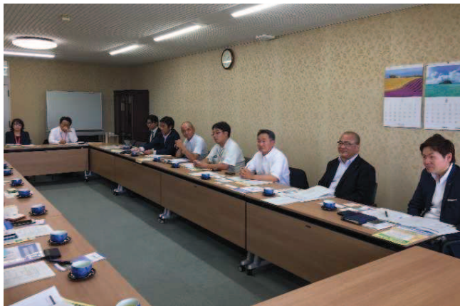
➤ 大村市中小企業推進会議委員の皆さん ・市の産業施策は我々が動かす、と推進会議の運営は、民間主導で行っている