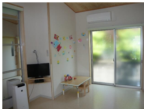
*病児対応型の保育室

病児保育施設は、病気で保育所や小学校に通えない子どもを一時的に預かる施設で、病後児保育施設は、回復はしているものの感染症などの理由で登園、登校できない子どもを預かる施設です。