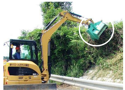
*ハンマーナイフ方式の最新草刈機