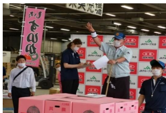
*日田西瓜の販促活動

また、テレビや雑誌、広告等のメディア、WEB等を活用して、多様なプロモーション戦略を展開することにより、ブランドの構築へとつなげていきます。