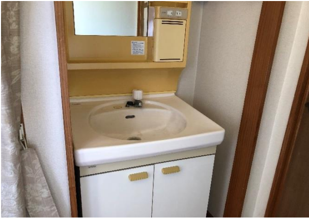
2階トイレ横洗面台