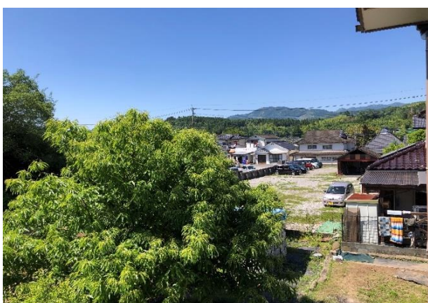
母家2階からの眺め