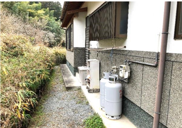
プロパンガス施設