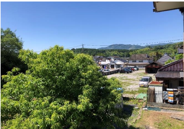
母家2階からの眺め