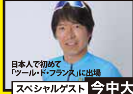
日本人で初めて「ツール・ド・フランス」に出場 スペシャルゲスト 今中大介