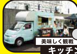
約10台 美味しく観戦 キッチンカー