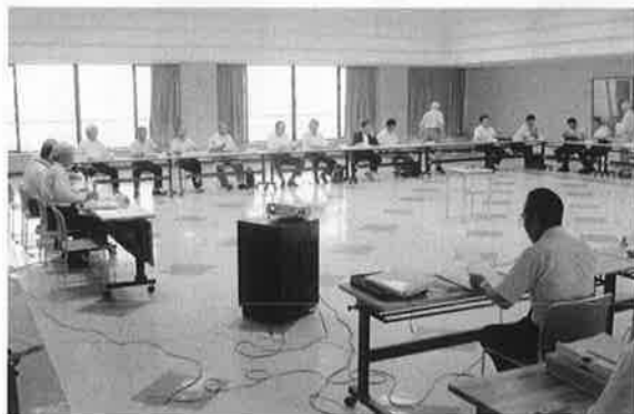
▲定例農業委員会のような様子

農地を住宅や店舗、資材置場、駐車場など農地以外の目的で使用するときは、農地法の転用許可が必要です。許可を受けずに工事に着手すると農地法違反として、工事の中止や原状回復等の命令がなされる場合があります。また、無断転用をした場合、3年以下の懲役、または300万円以下の罰金に処せられることがあります。 ※詳しいことについては、農業委員会事務局までお問い合わせください。(電話22・8213)