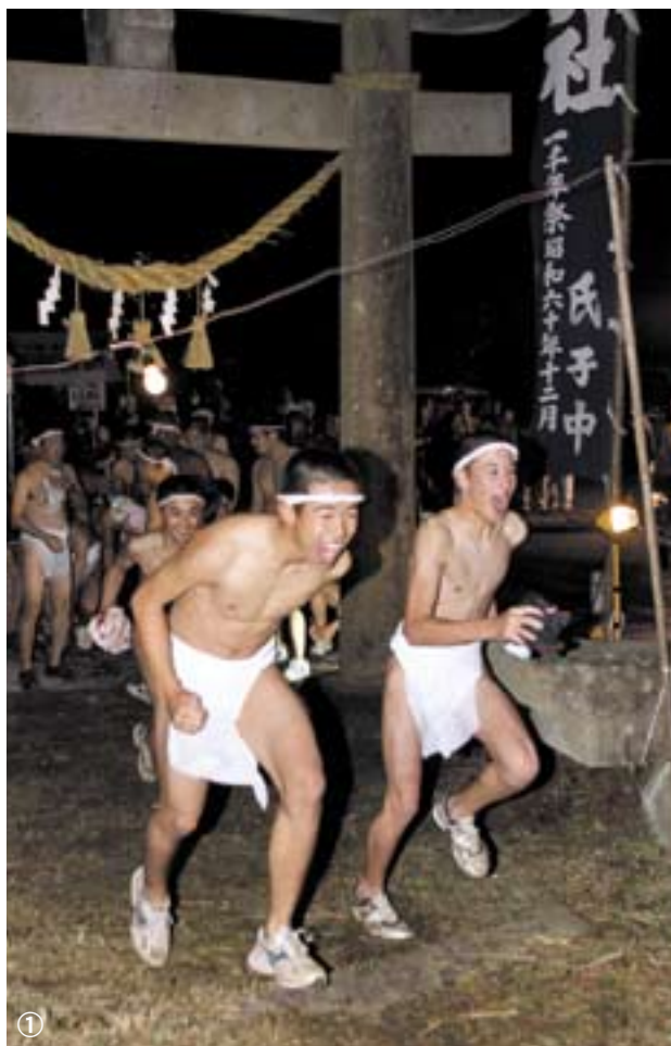
① 神社までの参道を勢いよく駆け上がる ② 締め込み姿で気合を入れ冷水をかぶる