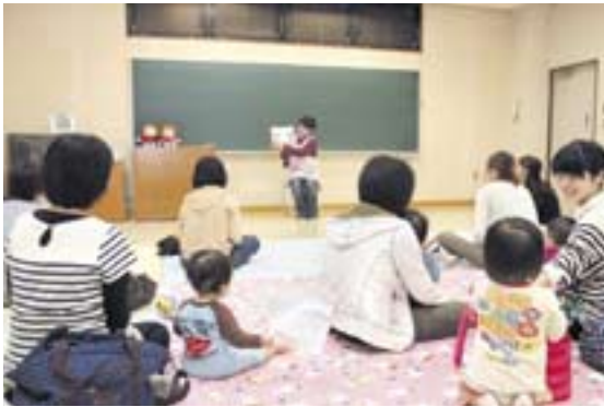
淡窓図書館で絵本のお話を聞く子供たち。まだ言葉の意味は分からなくても、その声や絵に興味を示す様子が見られました。