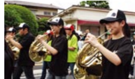
◎三隈中学校・大山中学校