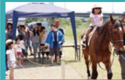
初めての乗馬にチャレンジ