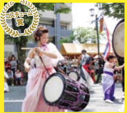
衣装に趣向を凝らし、 観客を楽しませた前津江浦和太鼓