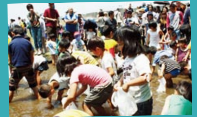
上手に捕れるかな？捕まえた魚はその場で炭火焼！