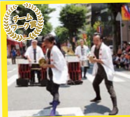
心を一つに、一糸乱れぬパフォーマンスで 観客を魅了した岳滅鬼太鼓