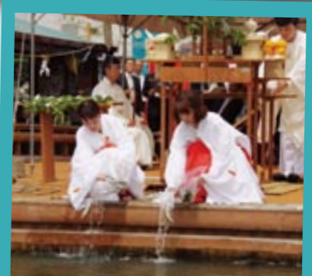
水神祭では1年の川の安全を願い鮎を放流