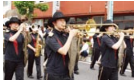
◎昭和学习園高校吹奏楽部