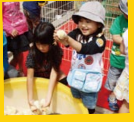
パトリア日田では、ミニボウリングやアニマルバルーン、移動動物園などが行われ、家族連れでにぎわいました。