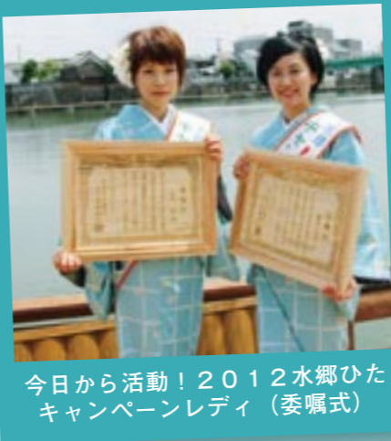
今日から活動！2012水郷ひたキャンペーンレディ（委嘱式）