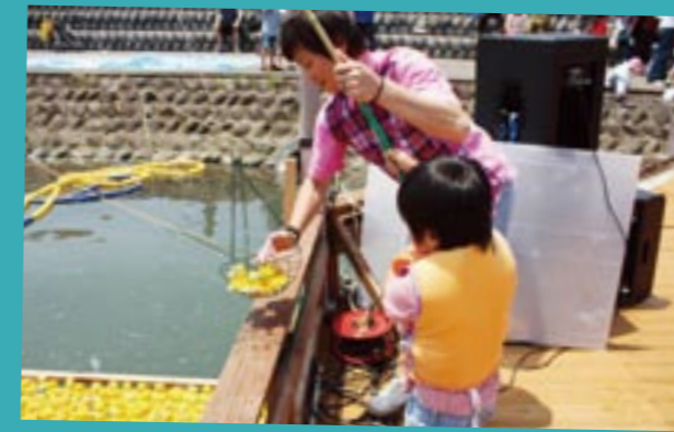
親子で挑戦！チキチキ家族 de ダック大漁祭り