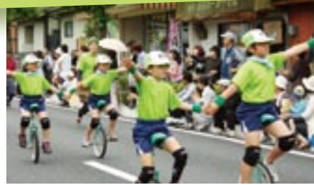
◎都築小学校一輪車チーム

市内の小・中学生、高校生約1,500人が参加した音楽大パレード。沿道で大勢の観客が見守る中、元気なパレードを披露しました。