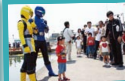
憧れのヒーローとハイチーズ