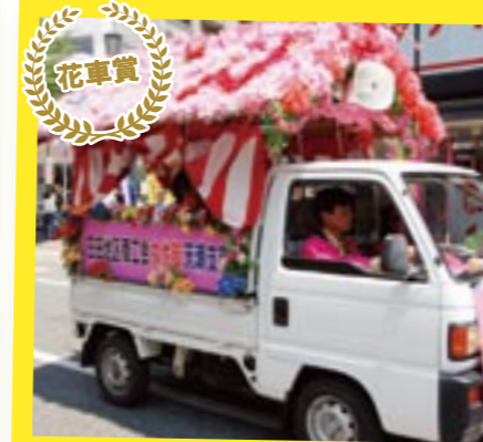
花車で観客を楽しませた 日田地区商工会女性部天瀬支部