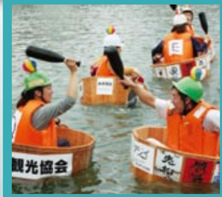
沈みにくい新型のハンギリで好プレー続出（ハンギリ源平合戦）