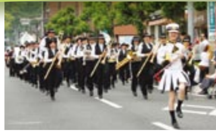
◎藤蔭高校吹奏楽部