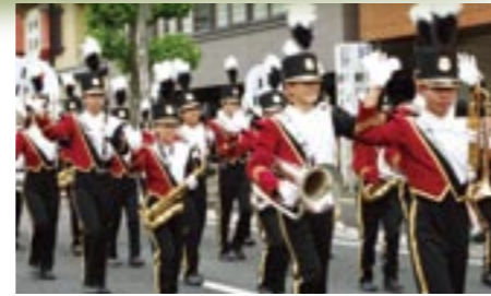
◎日田林工高校吹奏楽部