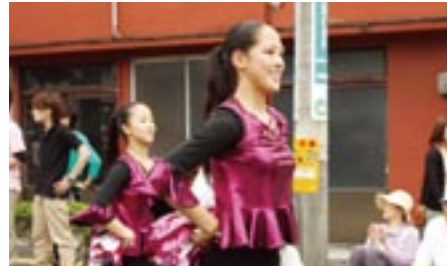
◎昭和学习園高校バトン部