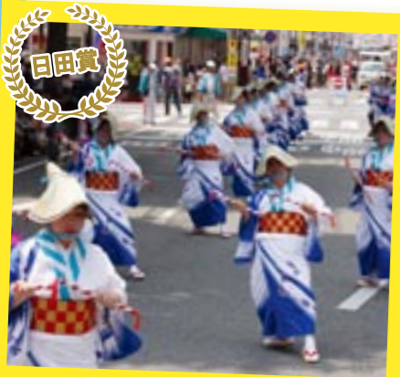
日田らしさを表現した 三本松芸能隊