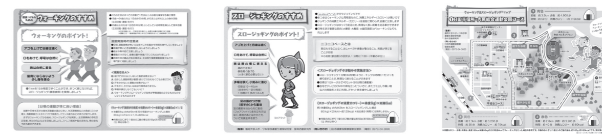
リーフレット：ウォーキングのすすめ面 リーフレット：スロージョギングのすすめ面 ウォーキングマップの一例 (日田市役所・大原総合運動公園コース)

◆運動に関する現状 市が行った平成24年度生活習慣実態調査では、青壮年期は約8割、高齢期は約6割の人が、自分は運動不足だと思ふと答えています。 加齢や日常生活で体を動かす機会が減ることによって、生活習慣病を発症する危険性が高くなります。予防や改善のためには運動が大切です。そのひとつとして、ウォーキングやスロージョギングがあります。