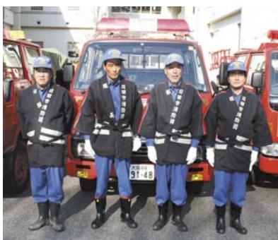
第4分団幹部の皆さんです

これからも地域の皆さんがいっまでも穏やかに生活できるように、少数精鋭ではありますが、地域を守っていきます。