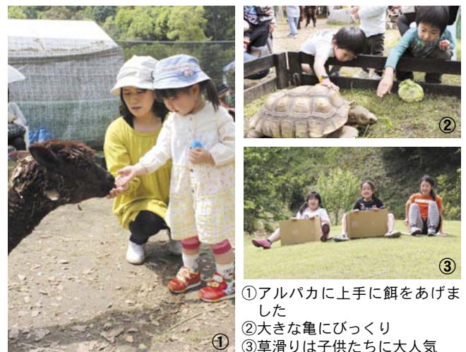
①アルパカに上手に餌をあげました ②大きな亀にびっくり ③草滑りは子供たちに大人気

人気のふれあい動物園では、長崎バイオパークからカピバラやアルパカなど16種類の動物が集合。子供たちは恐る恐る餌をあげたり、抱き上げたりして動物たちとの触れ合いを楽しんだ。