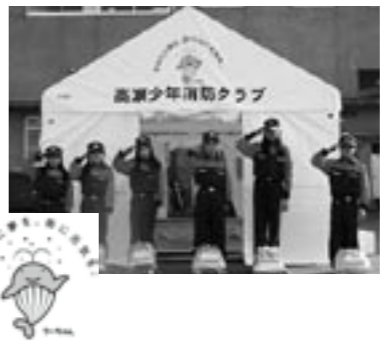
高瀬少年消防クラブ

じの収益金による「コミュニティ助成事業」を受けて、高瀬少年消防クラブが災害避難用中型テント・発電機・調理器具セット・救助工具セット・非常用持出袋セット等、自主防災・避難所体験訓練に必要な資機材を購入しました。 ※宝くじの収益金は、この他にも私たちの身近な道路や橋、社会福祉施設、医療機関等に使われ、「明るく住みよいまちづくり」に役立てられています。