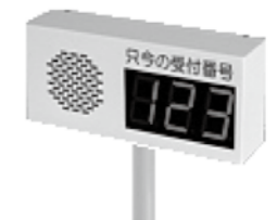
市民課窓口サービス係 ☎ 8204 (市役所1階)