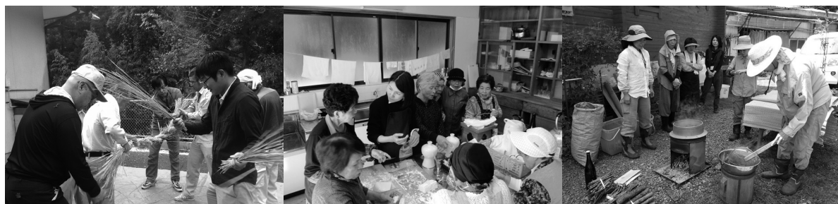
▲地域の祭りの準備