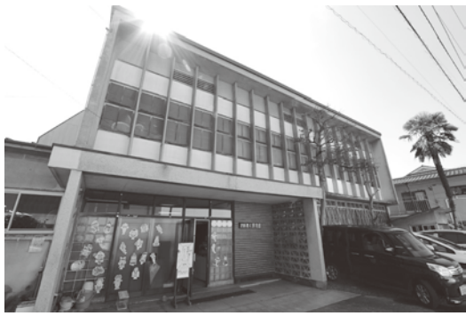
博物館 ☎ 253994