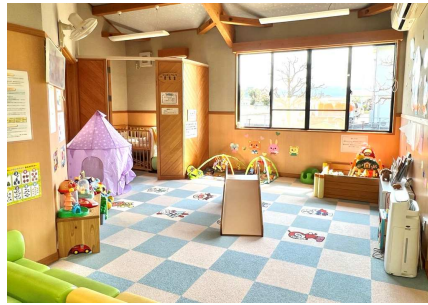
↑ 授乳室完備の乳幼児スペース