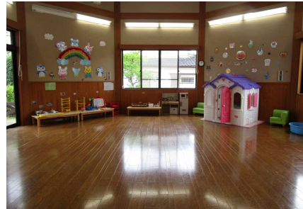
↑ 乳幼児世帯を受け入れる 広々プレイルーム