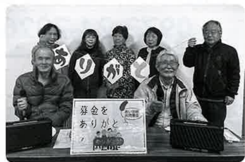
中津江地区社会福祉協議会