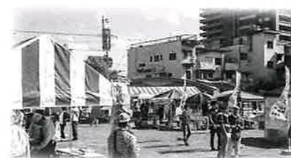
模擬店ひろば中央公園