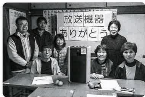
特定非営利活動法人 日田市レクリエーション協会