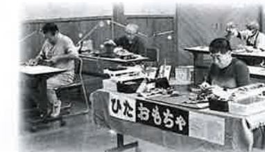
おもちゃ病院も開院します

☆福祉・健康・模擬店ひろば(パトリア日田屋外・中央公園) 10:00～15:00