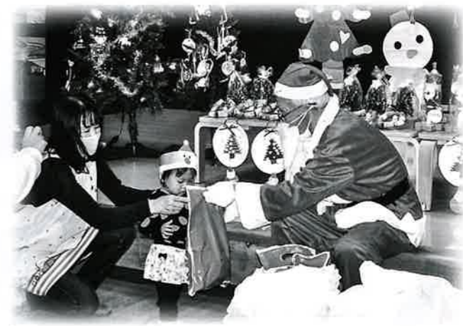
子育て世帯への支援活動へ

日田市内でご協力いただきました募金は、各地域の「地区社会福祉協議会」が行う、歳末たすけあい事業に充てられ、誰もが孤立することなく、安心して新年を迎えられるよう様々な活動が行われます。