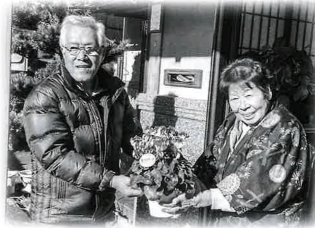
地域の見守り活動へ