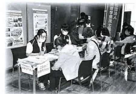
各種相談コーナーを設置