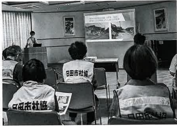
講義では能登地震での活動を説明

当日は災害ボランティアネットワーク ワーク連絡協議会の会員を中心に23名の方が参加されました。まず、石川県能登半島地震災害ボランティアの現状について講義を行い、その後は、2グループに分かれて被災者とボランティアをつなぐ「マッチング」体験、災害が起きた際に使用する資機材の実働体験をしました。