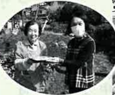
お弁当と笑顔をお届けします