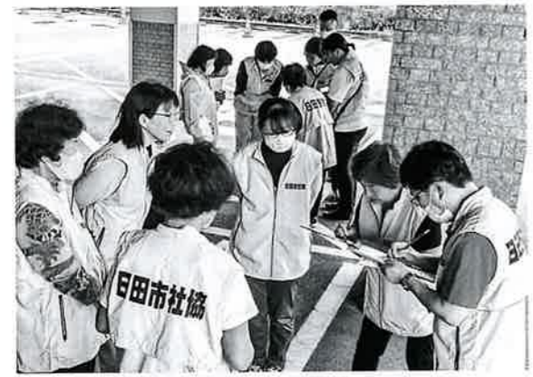
素早くグループ名簿を記入する参加者

○ マッチング班体験 マッチング班は、被災者からの様々な支援ニーズ(支援要請者)とボランティア活動者を結びつける役割を担います。スタッフ役と、ボランティア役に分かれ、支援ニーズの読み上げ、グループ作り・リーダー決めなどを行い、スムーズに運営する手法を学びました。