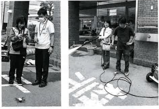
ドローンだけでなく、様々な機材を体験

○ 資機材班体験 資機材班では、発電機や高圧洗浄機等の設置方法から実際の起動までを学びました。その中でもひときわ大きな声の上があったのが「ドローン操縦」でした。カメラ付きドローンを自らコントロールして飛ばしてもらい、操作したり、カメラに写る映像を見てももらいました。こうした最新機材が活動において有意義に活用できることを、理解していただきました。参加者は「これは操作が難しい」と実際に操縦の難しさを感じたようでした。