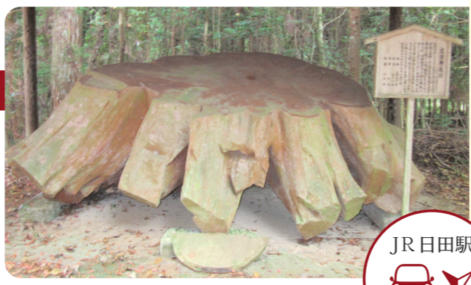
中津江村合瀬字宮園

宮園鎮座 津江神社には、参道沿いなどに杉の巨樹が立ち並び、日田地域の日田スギの原木とかつての植生が今に残されています。平成3年の台風災害で、多くの木が倒れましたが、在りし日の森の姿を示す杉林と切り株が氏子たちによって守られています。