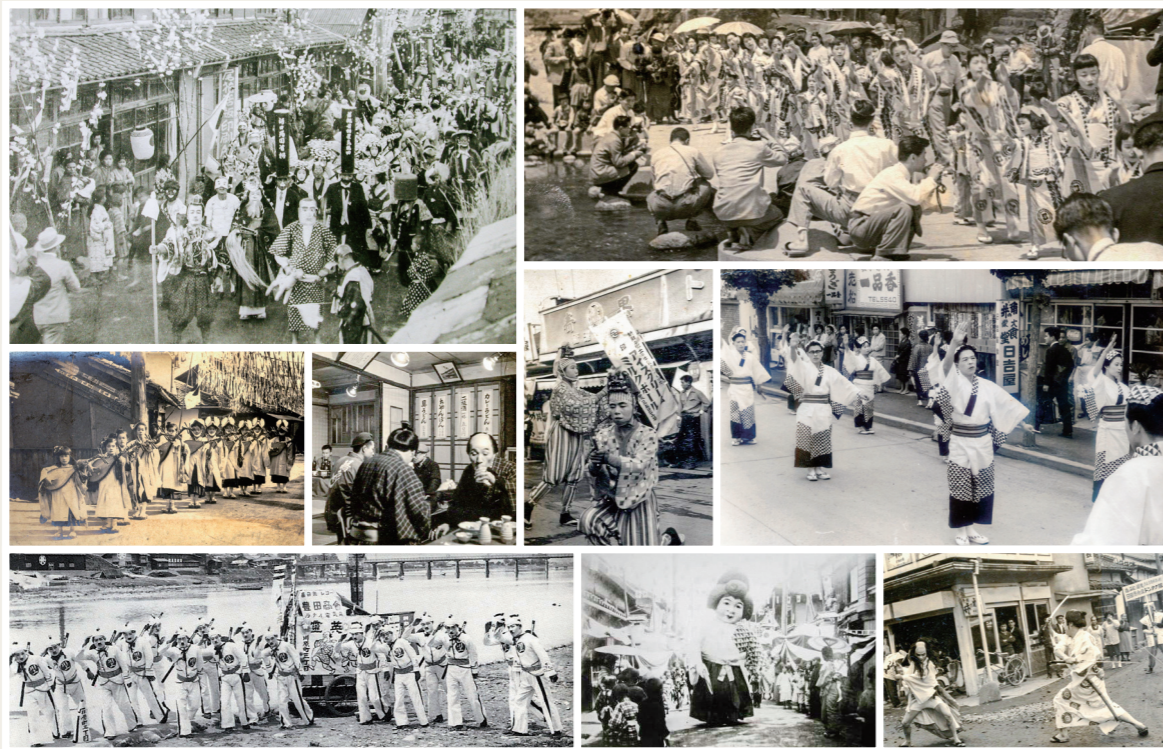
※この写真展に使用している写真は、令和2年度に開催した「日田市制80周年記念 水郷日田の風景」展で、市民の皆さんから提供いただいた貴重な思い出の写真です。