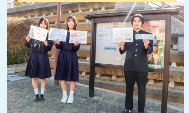
日田高等学校の生徒によるポスター掲示