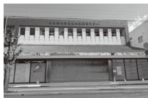
閉店した日田玖珠地域産業振興センター

市長 これまでのネットワークや繋がりを最大限に活かしたい。若者が地域のために活動したいという意欲を形にできる仕組みづくりを努めていく。