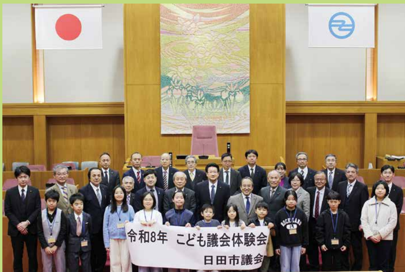
こども議会体験会終了後の集合写真