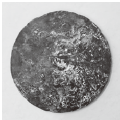
金銀錯嵌珠龍文鉄鏡