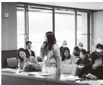
議員への質問の様子

参加した子どもたちから「日田杉で作られたバイオリンは少し特別な感じがしました。」といった感想をいただきました。