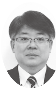
古賀 満 副市長