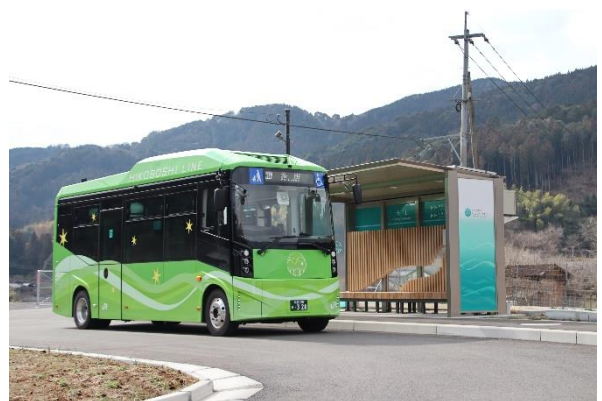
日田彦山線 BRT ひこぼしライン

彦山駅～宝珠山駅間の線路敷地を「専用道」に整備し、添田駅～彦山駅及び宝珠山駅～日田駅間については、地域住民の生活圏に近い「一般道」を走行することで、利便性の向上を図ります。