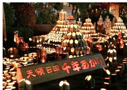
日田天領まつり・千年あかり

昼間は日田天領まつり、夜は約3万本の竹灯籠が花月川や豆田の町並みに並び、優しく照らす灯りの作品が幻想的な空間を作り出し、訪れた多くの人々の心を魅了します。