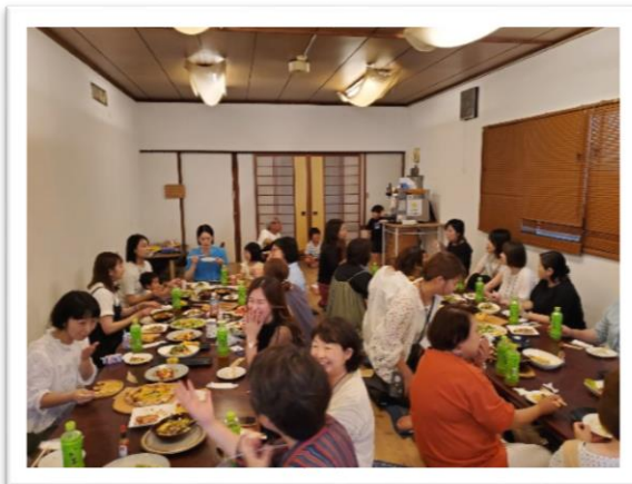
移住女子会第1弾（6月）

令和7年11月に開催した交流会では、「運動会」を行いました。チームで身体を動かすことで参加者たちと楽しい時間を過ごしました(^_^)