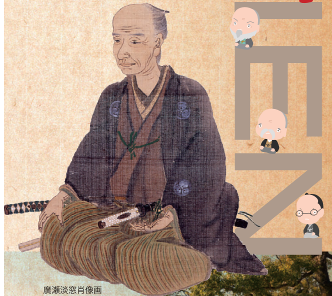
廣瀬淡窓肖像画