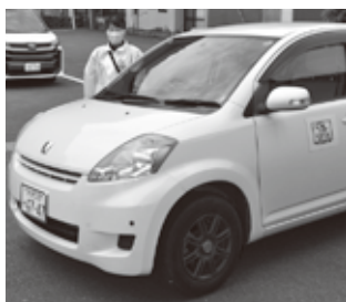
使用する車両にはロゴマークの入ったマグネットシートを貼っています。