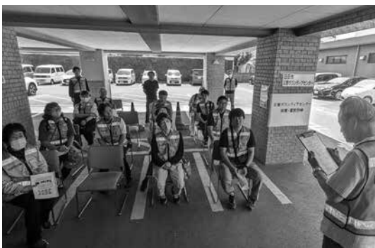
災害ボランティア訓練