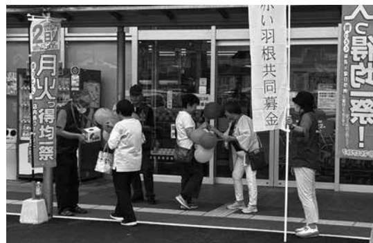
赤い羽根共同募金運動