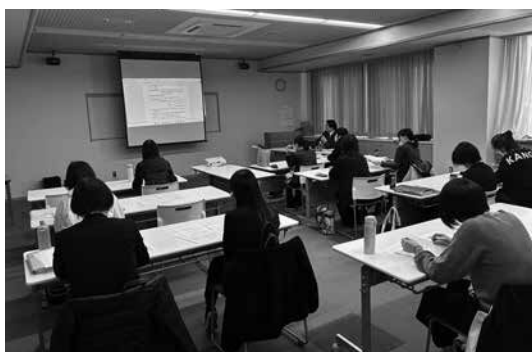
市民後見人養成講座