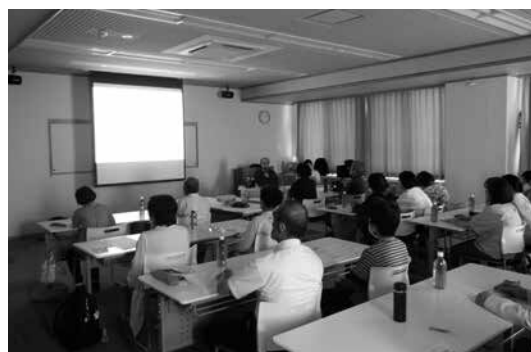
ボランティア養成講座