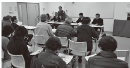
住民説明会の様子 全3つの自治会で皆さん声を聞きながら進めていきました。

利用された方からは「東溪分館や郵便局、老人クラブの集まりに参加するのでとてもありがたい。また、利用したい」といった声がかれました。