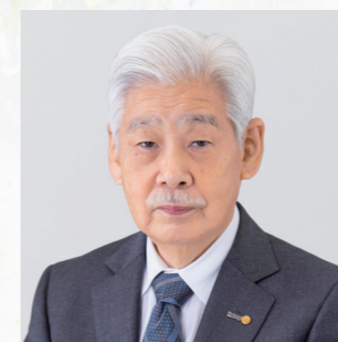
旭日単光章 地方自治功労