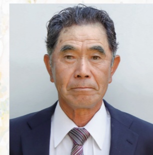
瑞宝双光章 消防功労