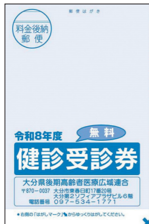
後期高齢者健診受診券