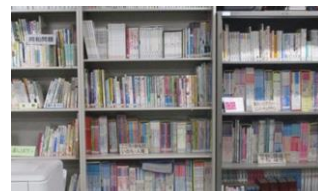
「人権文庫」(貸出可)「人権DVD」等もあり